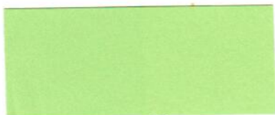
..... Mgr. Michal Gondžár konateľ spoločnosti Autor